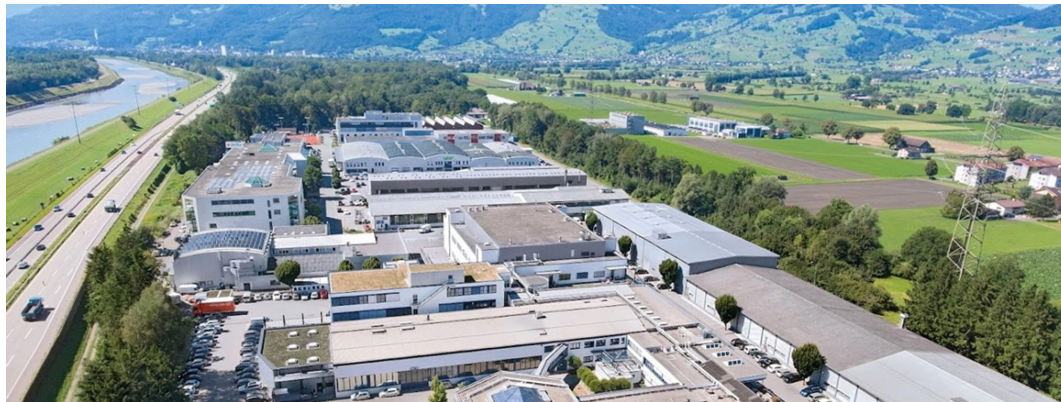
VAT Group (Haag / Rheintal, Kanton St. Gallen)

Das Privatmarktunternehmen Partners Group (-13%) ist nach einem guten Jahresstart wie andere aus der Branche arg unter Druck geraten. Infolge von KI-Ängsten in der Softwarebranche schwappten die schlimmsten Szenarien über Privatmarktmanager, weil diese auf allzu hohen Private Equity und Private Debt-Beteiligungen von disruptionsgefährdeten Unternehmen sitzen würden. Partners Group wies die Sippenhaft zurück, weil sie deutlich weniger als die Wettbewerber exponiert sei. Der Aktienkurs fiel in fünf Wochen um 20%.