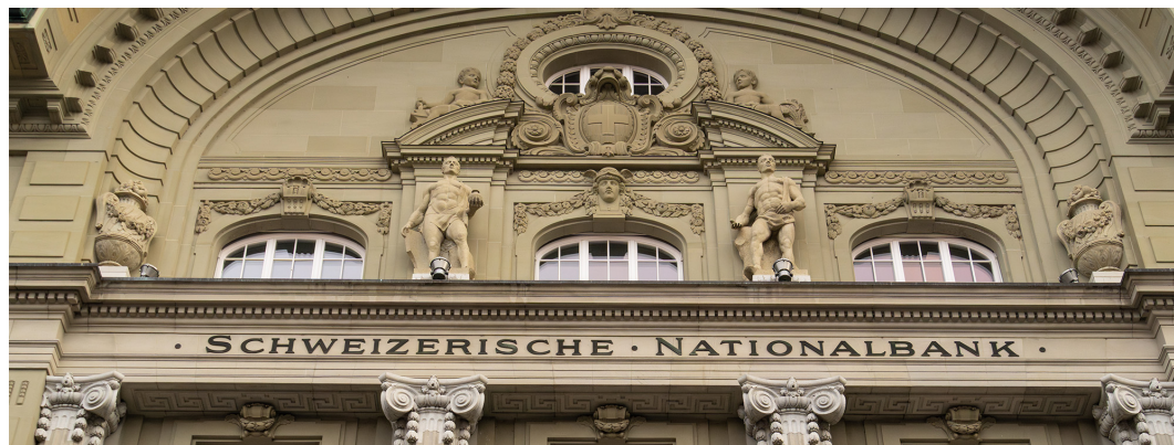
Schweizerische Nationalbank

Der Schweizer Franken bleibt eine starke Währung. Die Inflation steht praktisch bei Null, weshalb es auch bei der geldpolitischen Lagebeurteilung durch die Schweizerische Nationalbank in drei Wochen wohl keinen Anlass geben dürfte, etwas an den Leitzinsen von 0% zu ändern. Die Aufwertung in den ersten zwei Monaten gegenüber dem Dollar und dem Euro dürfte nun wohl eher in eine mehrmonatige Phase der Stabilität münden.