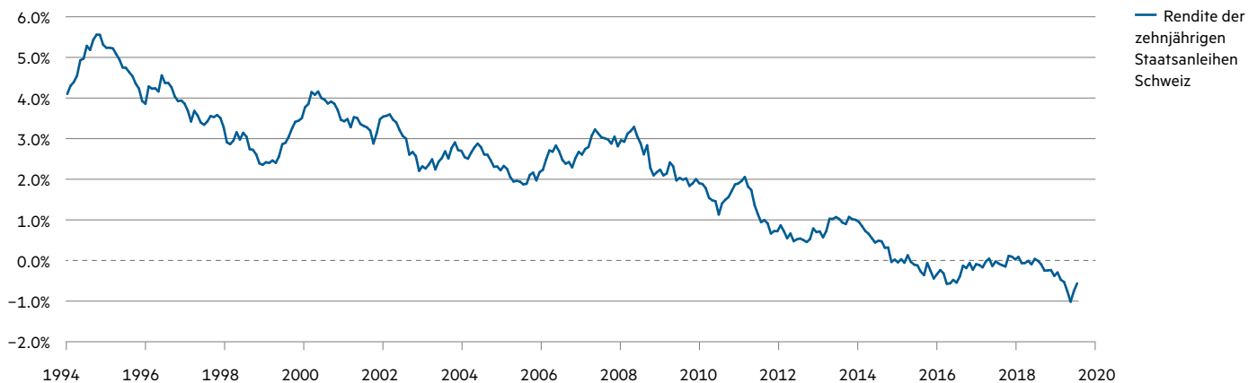
Renditeentwicklung der zehnjährigen Schweizer Staatsanleihen – 01.01.1994 bis 31.10.2019

Unter der neuen Führung von Christine Lagarde wird der EZB-Zentralbankrat entscheiden müssen, ob der bisherige geldpolitische Kurs fortgesetzt oder neu ausgerichtet werden soll. Dies ist von grosser Bedeutung, denn es geht um nicht weniger als das Setzen von wirtschaftlichen Impulsen mittels geldpolitischen und fiskalpolitischen Massnahmen. Für das erste ist die EZB zuständig, für das zweite die jeweiligen Regierungen.