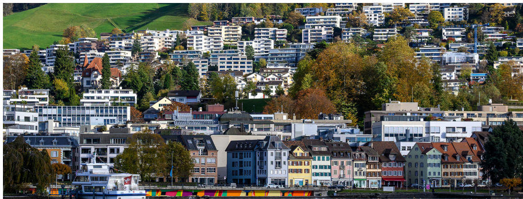
Ville de Zoug

En Suisse, les prix de l'immobilier ont atteint un sommet historique. C'est pourquoi il ne serait guère surprenant que les prix stagnent, en particulier dans le segment haut de gamme. Sur le long terme, ce n'est en aucune manière inquiétant, mais les acheteurs patients pourraient toutefois encore profiter d'un marché favorable à court et moyen terme. Pour l'instant, la tendance des prix immobiliers et des loyers reste toutefois à la hausse.