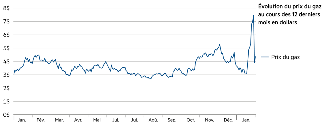
Évolution du prix du gaz au cours des 12 derniers mois en dollars (Bloomberg L.P. | Graphique : Zugerberg Finanz)

Dans le secteur de l'énergie, l'année 2026 a démarré de manière dramatique, tant sur le plan géopolitique que fondamental. Cette situation a engendré d'énormes fluctuations des prix du pétrole et du gaz, mais aussi des métaux industriels et précieux, ainsi que des cryptomonnaies. En dépit du renforcement des craintes d'offre excédentaire, les prix du pétrole ont fortement augmenté en janvier. Cela s'explique également par le fait que les données fondamentales commencent à s'améliorer sur le plan mondial.