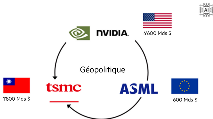
La géopolitique façonne le terreau entrepreneurial (Graphique : Zugerberg Finanz)

Certaines évolutions sont à peine perceptibles à court terme, mais elles sont déterminantes à long terme. C'est ce qui se passe actuellement avec l'économie mondiale, prise dans un triangle entre l'Occident global, l'Orient global et le Sud global. Ce triangle est en pleine mutation, et son influence se fait sentir également sur le terreau entrepreneurial. La performance économique augmente partout, mais à des rythmes différents.