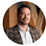
Christopher Breitenfeld Corporate Design e Media